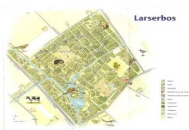
Lekker wandelen, fietsen in het bos

Staangeld 2018 € 900,= is inclusief: Verzekeringen, Belastingen, WOZ, riool, kabel TV, grote speeltuin, etc.