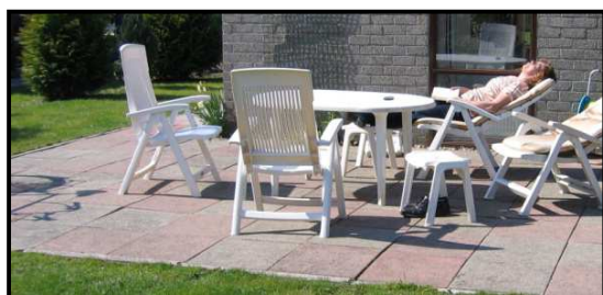
Lekker luieren in de zon