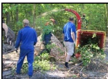
Gezond buiten “werken”